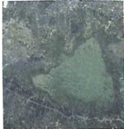
(b) AVNIR-ALOS, 10 meter