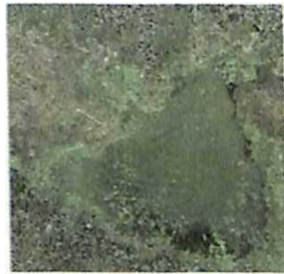
(d) IKONOS, 1 meter