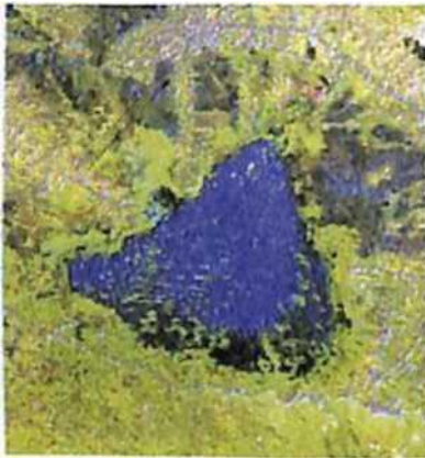
(a) SPOT-4, 20 meter

Saat ini teknologi penginderaan jauh satelit berkembang dengan sangat cepat, sehingga dapat menyediakan berbagai data penginderaan jauh optik dan SAR (Synthetic Aperture Radar) dengan karakteristik resolusi spasial, temporal dan spektral yang berbeda-beda. Data tersebut menjadi sumber data yang penting untuk pembuatan informasi spasial sumber daya alam dan lingkungan yang akurat, konsisten dan aktual. Gambar 3 memperlihatkan contoh data penginderaan jauh satelit dengan sensor optik dan SAR dalam berbagai resolusi yang dapat digunakan untuk penyediaan informasi perubahan fisik ekosistem danau untuk mendukung kegiatan pengelolaan danau lestari.